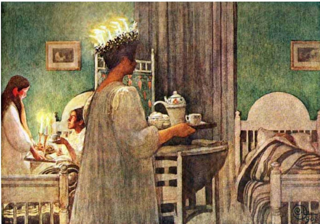
Lucia, door Carl Larsson 1908

haar. De meisjes hebben lange witte jurken aan met een rode ceintuur, de jongens zijn ook in het wit en dragen witte puntmutsen. Lucia en haar gevolg kondigt het nieuwe licht van de zon aan. Het rode ceintuur symboliseert de warmte van de zon; de witte kleren het licht van de zon. In lussekatter zit saffraan. Ook het gele saffraan symboliseert de zon. De broodjes zelf vertegenwoordigen het graan en voedsel dat Lucia bracht. Lucia brengt ook wel pepparkakor, gemberkoekjes, waarbij de gember de zon symboliseert. Deze vorm van het Luciafeest, waarin Lucia door het huis loopt met een kaarsenkroon en koffie en broodjes brengt, is aan het einde van de negentiende eeuw begonnen rondom het meer Värnern. In het begin van de twintigste eeuw is deze traditie langzaam verspreid geraakt over de andere delen van het Zweden.